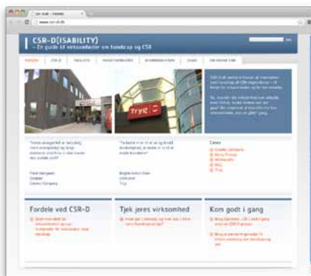
På www.csr-d.dk/ kan du læse meget mere om CSR-D. Blandt andet en tjeklist til, når man skal i gang med en CSR-D proces, indsatsområder, kommunikation og cases.

-Når først disability-dimensionen har lagret sig, vil virksomhederne tænke på mennesker med handicap som både en ressource og en kundegruppe. Det kalder så igen på nye måder at samarbejde på, fx med handicaporganisationerne. Og netop Handicaporga-