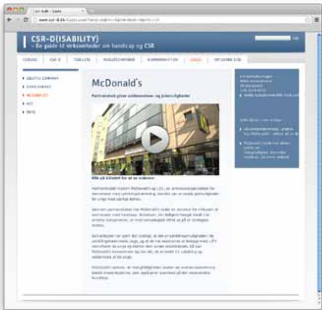
På http://www.csr-d.dk/ kan du læse McDonnald og CSR-D